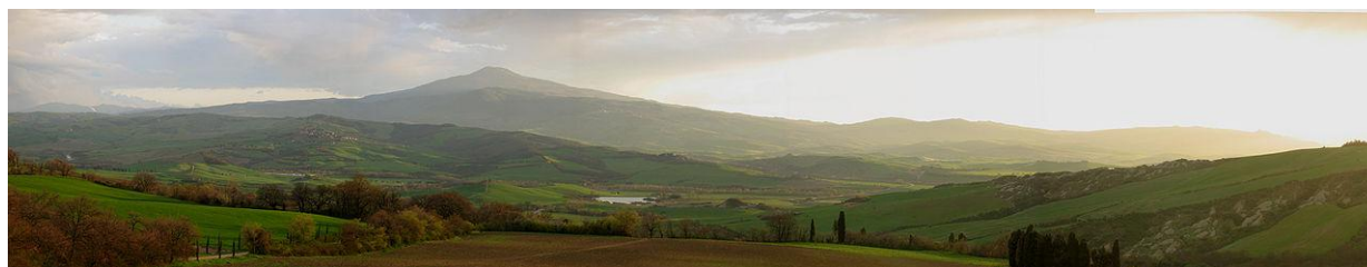
Panoramica del territorio Senese