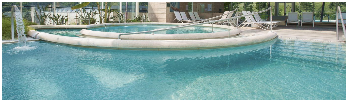
"Terme Theia" dove l'anima ed il nostro corpo saranno i protagonisti..