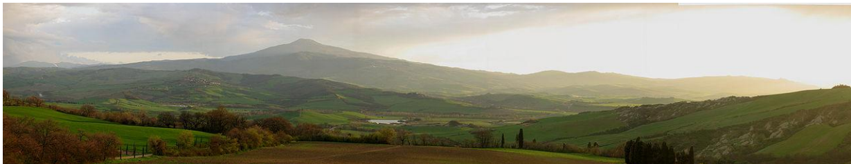
Panoramica del territorio Senese con sullo sfondo il Monte Amiata