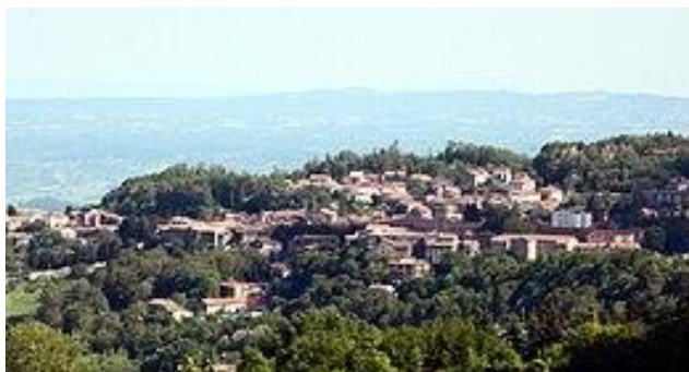
Abbadia San Salvatore