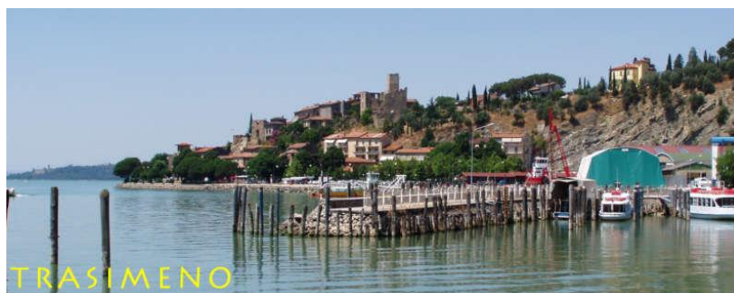
Passignano sul Trasimeno

Perugia e' una città' dell'Italia centrale con 162.275 abitanti, circa 240.000 nell'intera area urbana, capoluogo di provincia e della regione Umbria. Sorge su un colle, nella valle del Tevere. Celebre città d'arte ricca di storia e monumenti, è un rilevante polo culturale ed economico e meta di numerosi turisti e studenti. È sede di una delle più antiche Università' degli Studi della penisola (fondata nel 1308), oltre che della maggiore Università' per stranieri d'Italia. Da sempre innovativa nel campo dei trasporti pubblici, già a partire dal 1980 si è dotata di percorsi meccanizzati quali scale mobili e ascensori per collegare l'acropoli del centro storico con le zone periferiche. Perugia inoltre possiede una metropolitana leggera sopraelevata, il Minimetro'.