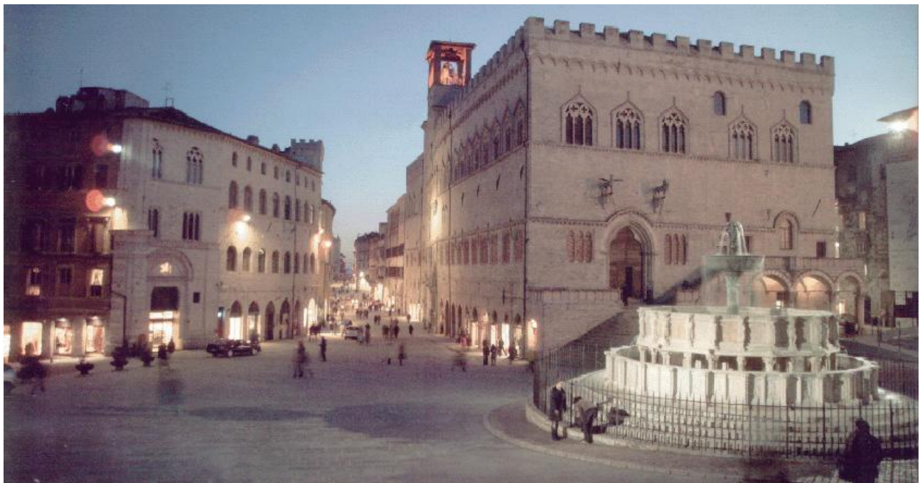
Perugia (Fontana Maggiore e Palazzo dei Priori)

Perugia e' una città' dell'Italia centrale con 162.275 abitanti, circa 240.000 nell'intera area urbana, capoluogo di provincia e della regione Umbria. Sorge su un colle, nella valle del Tevere. Celebre città d'arte ricca di storia e monumenti, è un rilevante polo culturale ed economico e meta di numerosi turisti e studenti. È sede di una delle più antiche Università' degli Studi della penisola (fondata nel 1308), oltre che della maggiore Università' per stranieri d'Italia. Da sempre innovativa nel campo dei trasporti pubblici, già a partire dal 1980 si è dotata di percorsi meccanizzati quali scale mobili e ascensori per collegare l'acropoli del centro storico con le zone periferiche. Perugia inoltre possiede una metropolitana leggera sopraelevata, il Minimetro'.