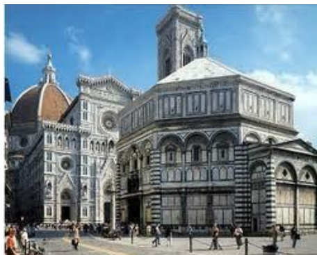
Il Battistero, di fronte al Duomo