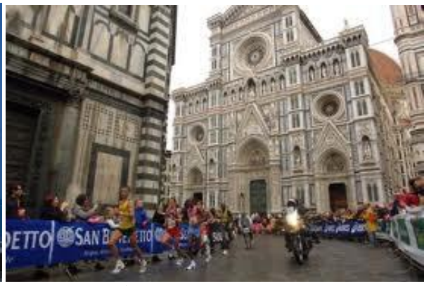
La facciata del Duomo

Arrivo previsto a Piazza Ognissanti , verso circa le ore 12,00 , molto probabilmente si potrà mangiare qualche stuzzichino presso un vicino locale, stiamo ancora cercando di risolvere al meglio questo piccolo appuntamento gastronomico, se non ci sarà possibile (lo comunicheremo al momento) ognuno sarà libero di pranzare e di effettuare la visita al centro città.