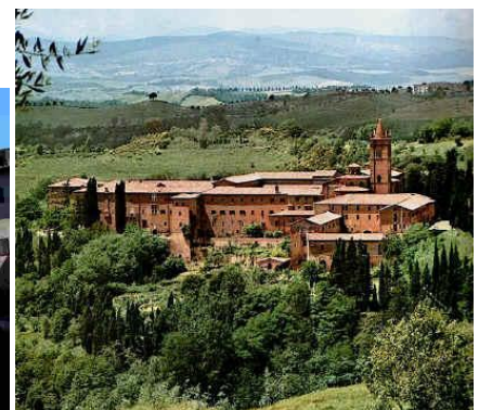
Abbazia di Monte Oliveto Maggiore

L'itinerario prosegue per raggiungere un'altra notissima località storico culturale, altra capitale di produzione del vino italiano, il rinomato "Brunello di Montalcino" .