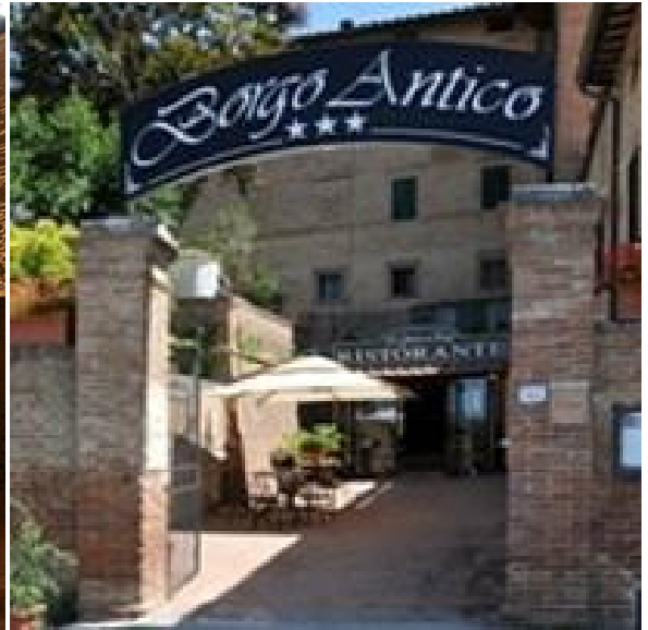
Hotel Borgo Antico

Ore 20,30 cena presso il ristorante "Il Contedino" , di fianco all'hotel "More di Cuna" (cena tipica della cucina maremmana)