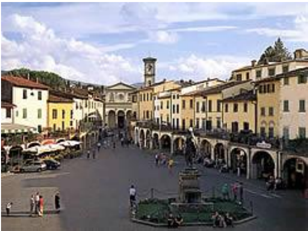
Greve in Chianti

Greve in Chianti, Castellina in Chianti, Radda in Chianti, Montegrossoli e Gaiole in Chianti.