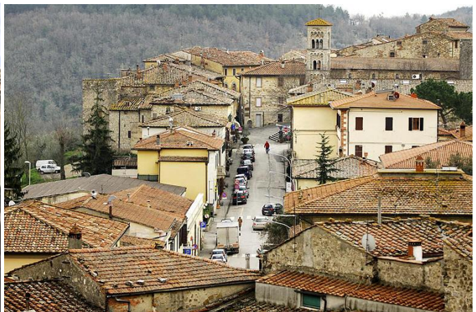
Castellina in Chianti