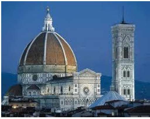
La cupola del Duomo