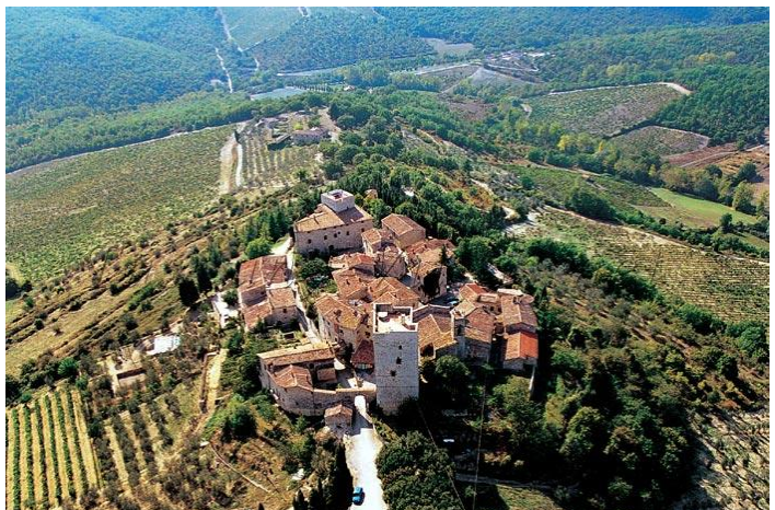
Gaiole in Chianti