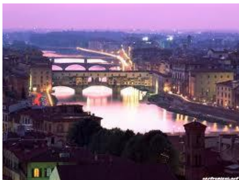
Ponte Vecchio sullo sfondo

Alle ore 11,30, partenza per entrare nel centro storico di Firenze, scortati da due motociclisti della Polizia Municipale. L'ingresso riservatoci dalle Autorita' e veramente molto bello ed interessante, percorreremo a bordo delle nostre Matra, passeremo vicino al famoso Ponte Vecchio, percorrendo le rive dell' Arno, passeremo davanti al Palazzo Pitti, famoso per le sfilate di moda italiana, poi la famosissima Via Maggio, il ponte di Santa Trinita', per raggiungere infine la piazza a noi riservata, Piazza Ognissanti.