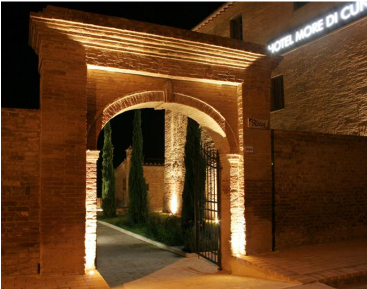
Hotel More di Cuna

Tel. 0577/3714688 http://www.hotelborgoantico.com/